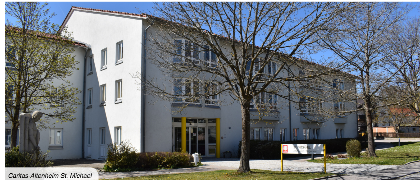
Caritas-Altenheim St. Michael