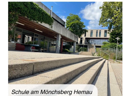
Schule am Mönchsberg Hemau