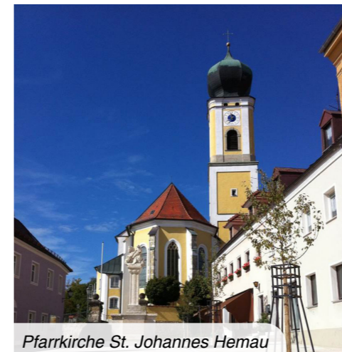
Pfarrkirche St. Johannes Hemau

Das Kloster Eichlberg ist seit Ende 2019 Zuhause für Patres des Ordens der unbeschuhten Karmeliten.