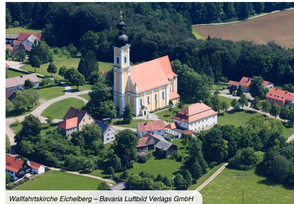
Wallfahrtskirche Eichelberg

In den letzten Jahrzehnten wurden zahlreiche Feld- und Wanderwege mit Unterstützung der Stadt Hemau und dem Land Bayern aus- bzw. neu gebaut. Diese Wege eignen sich auch hervorragend als Fuß- und Radwanderwege. Sie führen etwa über freie Feld- und Wiesenflächen, durch Wälder und zahlreiche Dörfer mit sehenswerten Kirchen und Kapellen.