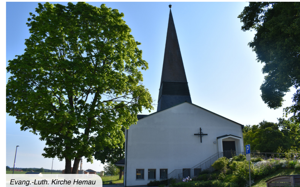
Evang.-Luth. Kirche Hemau