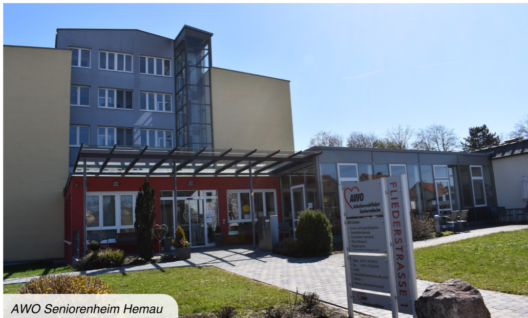
AWO Seniorenheim Hemau