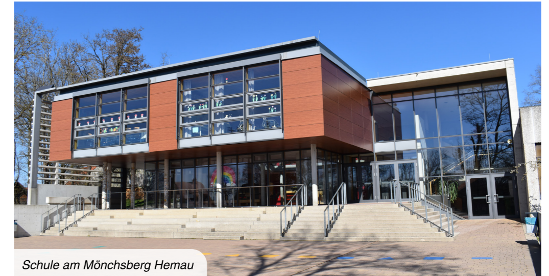
Schule am Mönchsberg Hemau

Johann-Simon-Mayr-Schule Staatliche Realschule Schulstraße 21 93339 Riedenburg Tel. 09442/92 010