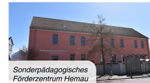
Sonderpädagogisches Förderzentrum Hemau

Gymnasium Parsberg Aschenbrennerstraße 10 92331 Parsberg Tel. 09492/60 10 050