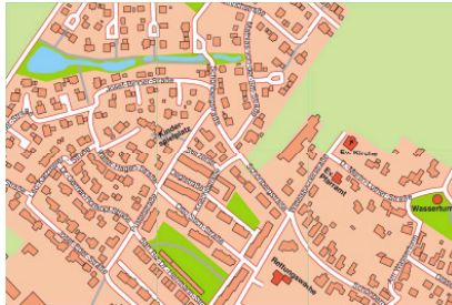
Ausschnitt, vgl. Straßenverzeichnis Hemau, E 3