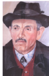
Porträt eines Hemauers