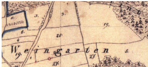
Uraufnahmeblatt Hohenschambach 1832, „Weingarten“ (Ausschnitt)

Eine „Weinbreite“ findet sich als alte Flurbezeichnung aus dem Jahre 1830 zwischen den Ortschaften Kollersried und Laufenthal. Der Name weist auf einen einstigen Weinbau in dieser Gegend hin; gleiches gilt auch für die oft belegte Flurbezeichnung „Weinberg“. „Weingarten“ ist für diese Gegend ebenfalls bekannt; ein solcher befindet sich beispielsweise am Ortsrand von Hohenschambach.