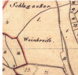
Uraufnahmeblatt Laufenthal 1830, „Weinbreite“, Ausschnitt

Eine „Weinbreite“ findet sich als alte Flurbezeichnung aus dem Jahre 1830 zwischen den Ortschaften Kollersried und Laufenthal. Der Name weist auf einen einstigen Weinbau in dieser Gegend hin; gleiches gilt auch für die oft belegte Flurbezeichnung „Weinberg“. „Weingarten“ ist für diese Gegend ebenfalls bekannt; ein solcher befindet sich beispielsweise am Ortsrand von Hohenschambach.