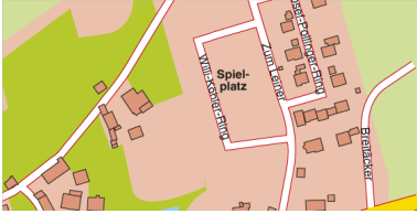
Ausschnitt, vgl. Straßenverzeichnis Hemau, K 26 – L 26

vgl. auch Langenkreith, → Josef-Pollinger-Ring