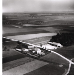
Luftbildaufnahme 1959, Ausschnitt. Blick auf das „Köhleranwesen“