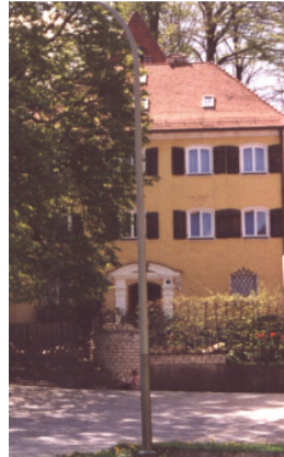
Blick auf das Schloss, 1998

Die Straße wurde vormals „Schloßgasse“ genannt; wohl nicht zuletzt aus Gründen der besseren Unterscheidbarkeit oder um etwaige bzw. in der Vergangenheit bereits öfters vorgefallene Verwechslungen mit der seitwärts einmündenden „Obere(n) Gasse“ zu vermeiden, wird sie nunmehr in leicht abgeänderter Form als „Schloßberg“ angesprochen. Der unmittelbare Bezug zu dem auf einer Anhöhe gelegenen Schloss kommt bei dieser Namensgebung ohnehin mehr zur Geltung.