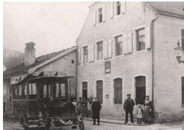
„altes“ Postamt und „Postauterl“, 1910

Zu Beginn des 20. Jahrhunderts wurde in Hemau eine Postexpedition mit festem Sitz am → Oberen Stadtplatz im Hause des Prätorius eingerichtet; die „Postgasse“ führte zum ehemaligen, im Kreuzungsbe- reich beider Straßen stehenden Postgebäude („Posthaltere“).