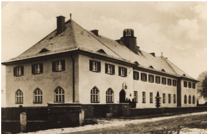
„Post- und Verstärkeramt“ an der Nürnberger Straße

In späterer Zeit wurde das Postgebäude an der Nürnbergerstraße bezogen; im Jahre 1927 kam noch ein „Verstärkeramt“ hinzu.