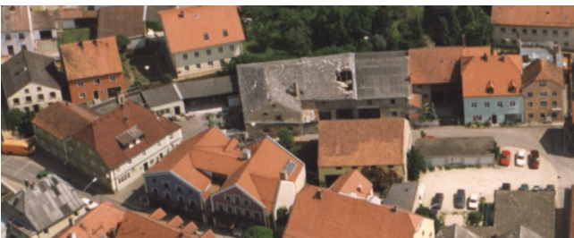
Luftbildaufnahme 1994, Ausschnitt Blick auf die ehemalige „Posthaltere“

Zu Beginn des 20. Jahrhunderts wurde in Hemau eine Postexpedition mit festem Sitz am → Oberen Stadtplatz im Hause des Prätorius eingerichtet; die „Postgasse“ führte zum ehemaligen, im Kreuzungsbe- reich beider Straßen stehenden Postgebäude („Posthaltere“).