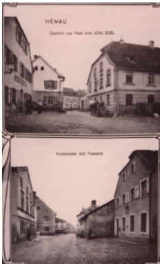
Gasthof „Zur Post“, „altes“ Postamt