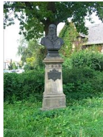
Jahndenkmal in Neubrandenburg