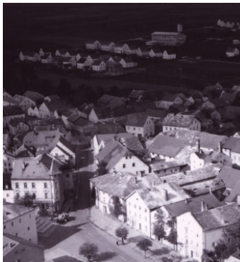
Luftbildaufnahme 1959 mit Blick auf den „Heimweg“ (oberer Bildbereich)

So benannt aufgrund der straßennahen Heimkehrersiedlung, welche man im Jahre 1953 zu bauen begann und sich schwerpunktmäßig im Flurbereich der einstigen sog. „Grosse Probstei-Breiten“ befindet.