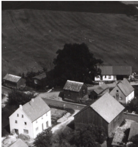
Luftbildaufnahme aus dem Jahre 1959

Die Straße verdankt ihren Namen einer uralten, stämmigen Eiche, wie sie nach ortskundiger Auskunft auch heute noch am Straßenrand nahe an der westlichen Einmündung in die → Obere Hauptstraße steht.