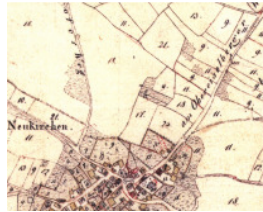
Uraufnahmeblatt Neukirchen 1830, Ausschnitt