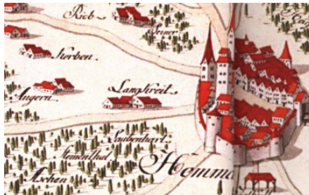
Vogelsche Landkarte 1598 (Kopie), „Angern bei LangKreit (!)“, Ausschnitt

Der „ Angerer Steig “ führte früher als einfacher Fußpfad zu dem benachbarten Dorf Anger. Der Begriff selbst bezeichnete ursprünglich ein „ Weideland; eingezäuntes Grundstück in Sondernutzung “, öfters ist damit auch ein Ackerland gemeint, das zu einer Hofmark gehörte.