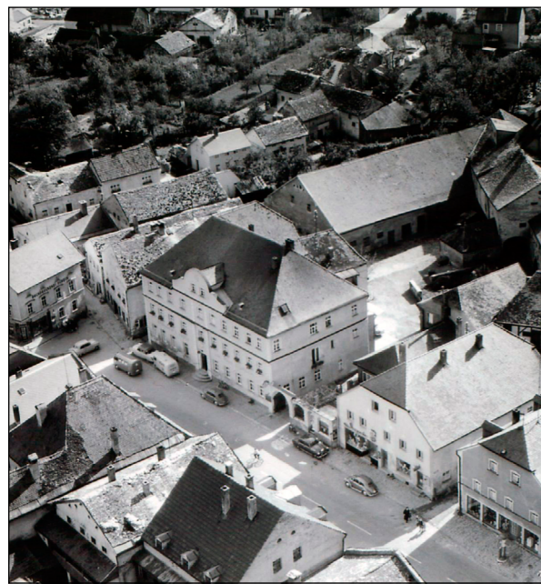
Stadtplatz mit Donhauser

Der Heimatfilm kann auch in einzelnen Teilen (1-4) angesehen werden, wobei aus Gründen der Vollständigkeit alle weiteren Teile angehängt sind.