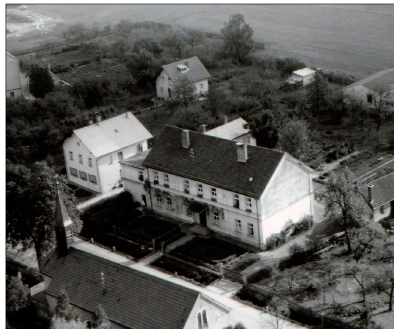
ehemalige Mädchen- bzw. Grundschule